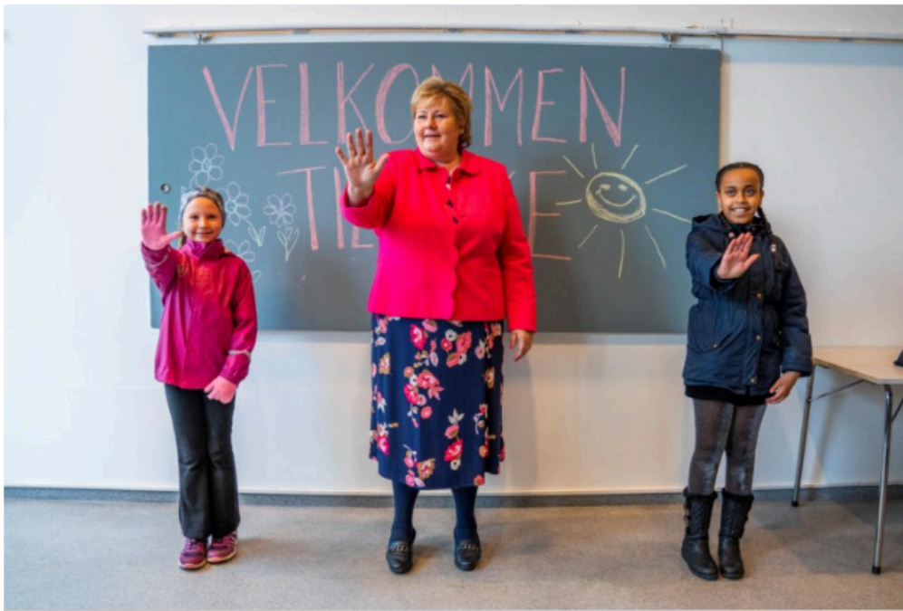
Erna Solberg, premier van Noorwegen.