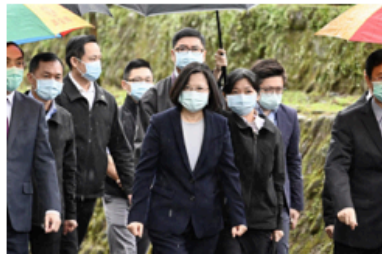
Tsai Ing-wen (m.), de president van Taiwan.

Donald Trump heeft een uitgesproken mannelijke leiderschapsstijl. Is hij geschikt om zijn land door deze crisis te loodsen?