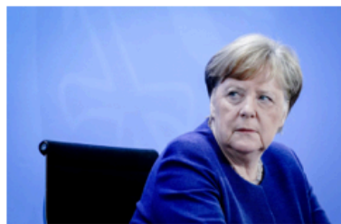
Angela Merkel, Duits bondskanselier.

'We weten niet hoe zij achter de schermen functioneert. Misschien kan zij wel zoals Herman Van Rompuy, de voormalige president van de Europese Unie, alle partijen op één lijn krijgen. Bij zulke complexe vraagstukken is gedeeld leiderschap wel nodig, zeker in de Belgische politieke context. Ik vond het goed dat Wilmès in het begin tijd nam. Ik ging ervan uit dat ze elke minister en expert de kans gaf om zijn rol als leider op te nemen. Ik vond het niet erg dat minister Ben Weyts zijn visie op het beleid in de Vlaamse scholen heeft. Hij is daarvoor tenslotte verantwoordelijk.'