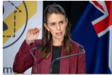
Jacinda Ardern, premier Nieuw-Zeeland.

'Maar die vrouwelijke premiers geven ook veel aandacht aan het leed van de bevolking. Ze stellen zich kwetsbaar op. Angela Merkel spreekt niet alleen zakelijk over de gevaren van te vroeg uit de lockdown te komen, maar ze zegt ook dat niemand weet wanneer het virus weer zal toeslaan. De Noorse premier Erna Solberg organiseerde een persconferentie voor kinderen, omdat ze wist dat die bang waren. De Nieuw-Zeelandse premier Jacinda Ardern, die haar land snel onder de stolp heeft gezet, straalt empathie en bezorgdheid uit.'