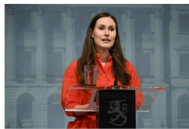
De Finse premier Sanna Marin.

'Populariteit is niet gelijk aan effectiviteit. Zeker zo vroeg in de crisis hangt populariteit af van de wijze waarop de leiders een boodschap kunnen brengen die aanslaat. Storytelling, een coherent verhaal hebben, is een belangrijke skill voor leiders. Macron en Rutte zijn authentiek. Zij vertellen aan hun bevolking, ieder in hun eigen stijl, waar het op aankomt. Macron praat over La France en houdt motiverende